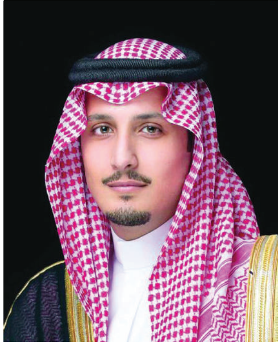
صاحب السمو الملكي الأمير