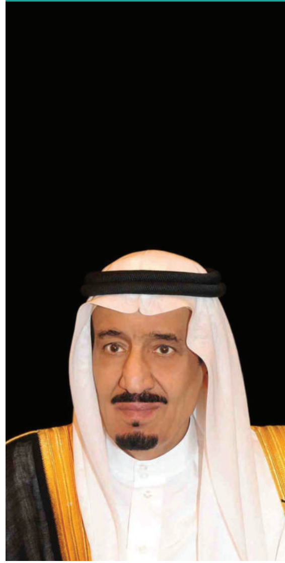
خادم الحرمين الشريفين