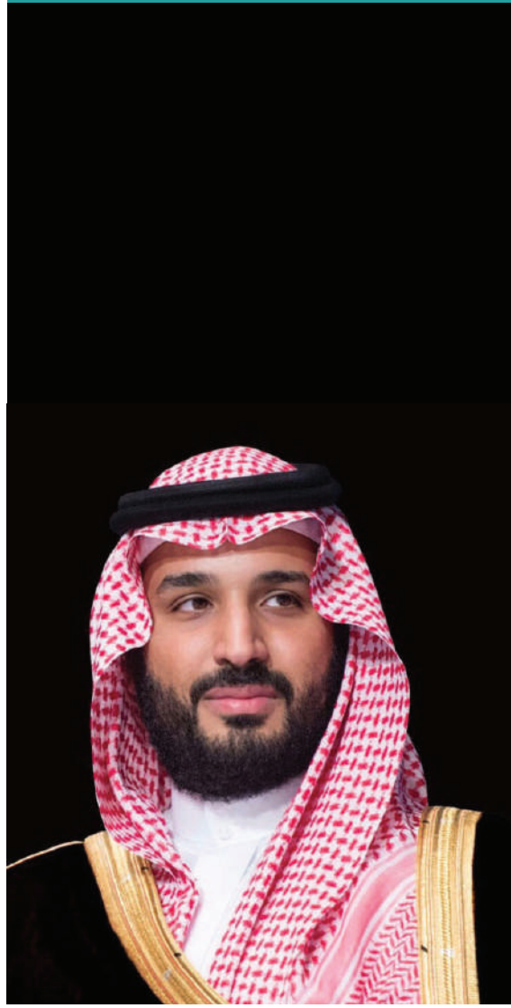
صاحب السمو الملكي

الأمير محمد بن سلمان بن عبدالعزيز آل سعود