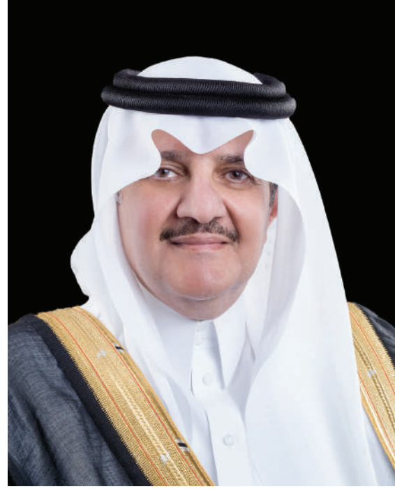
صاحب السمو الملكي الأمير